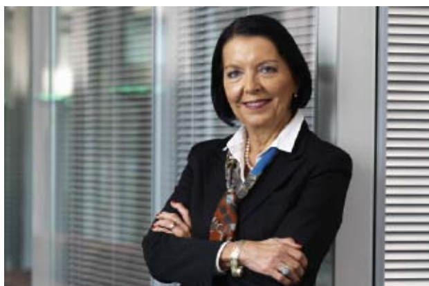
Christine Hohmann-Dennhardt | 63 , Integrität und Recht Bestellung bis Februar 2017