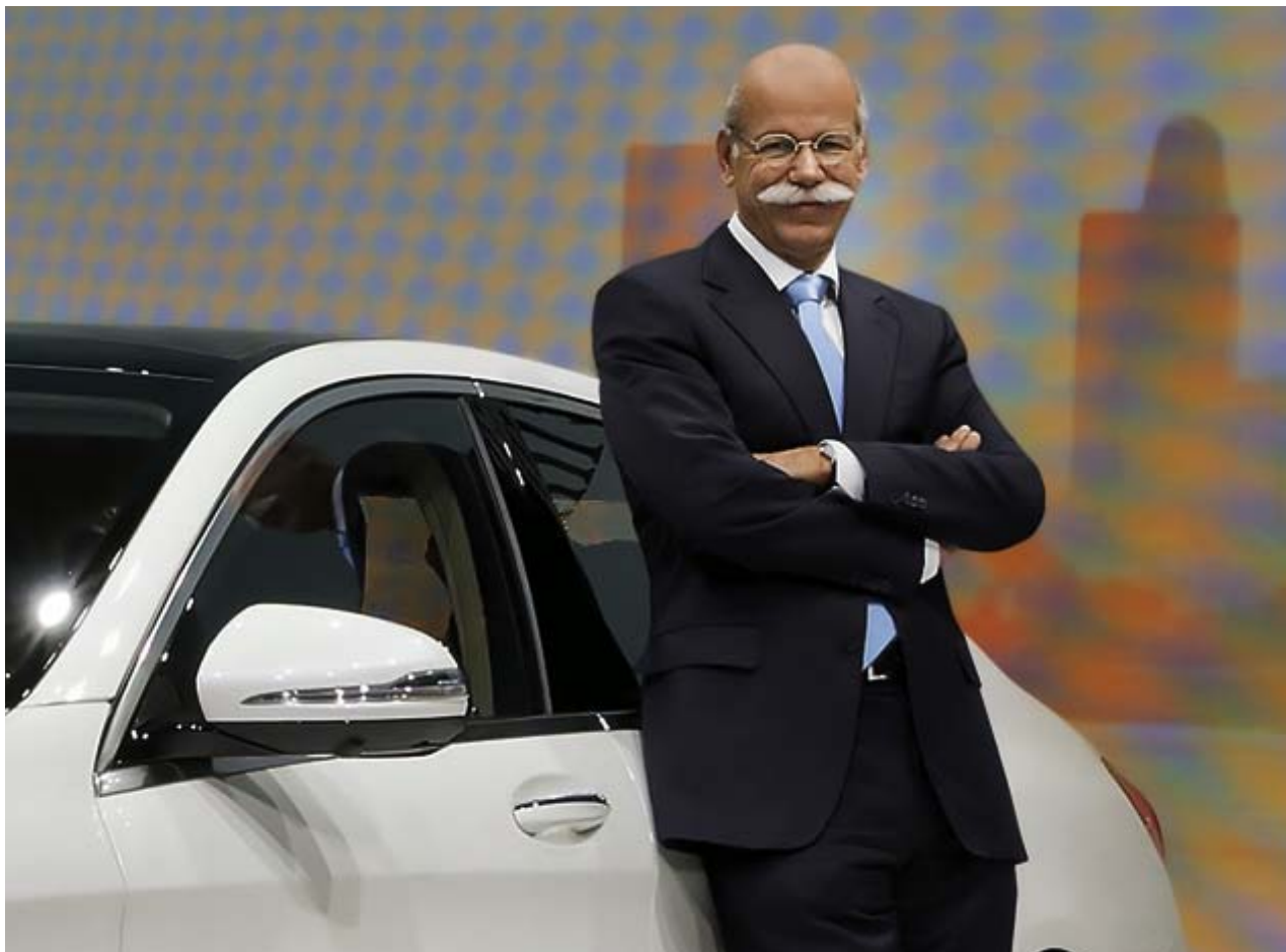
Dieter Zetsche | 60 , Vorsitzender des Vorstands, Leiter Mercedes-Benz Cars Bestellung bis Dezember 2016