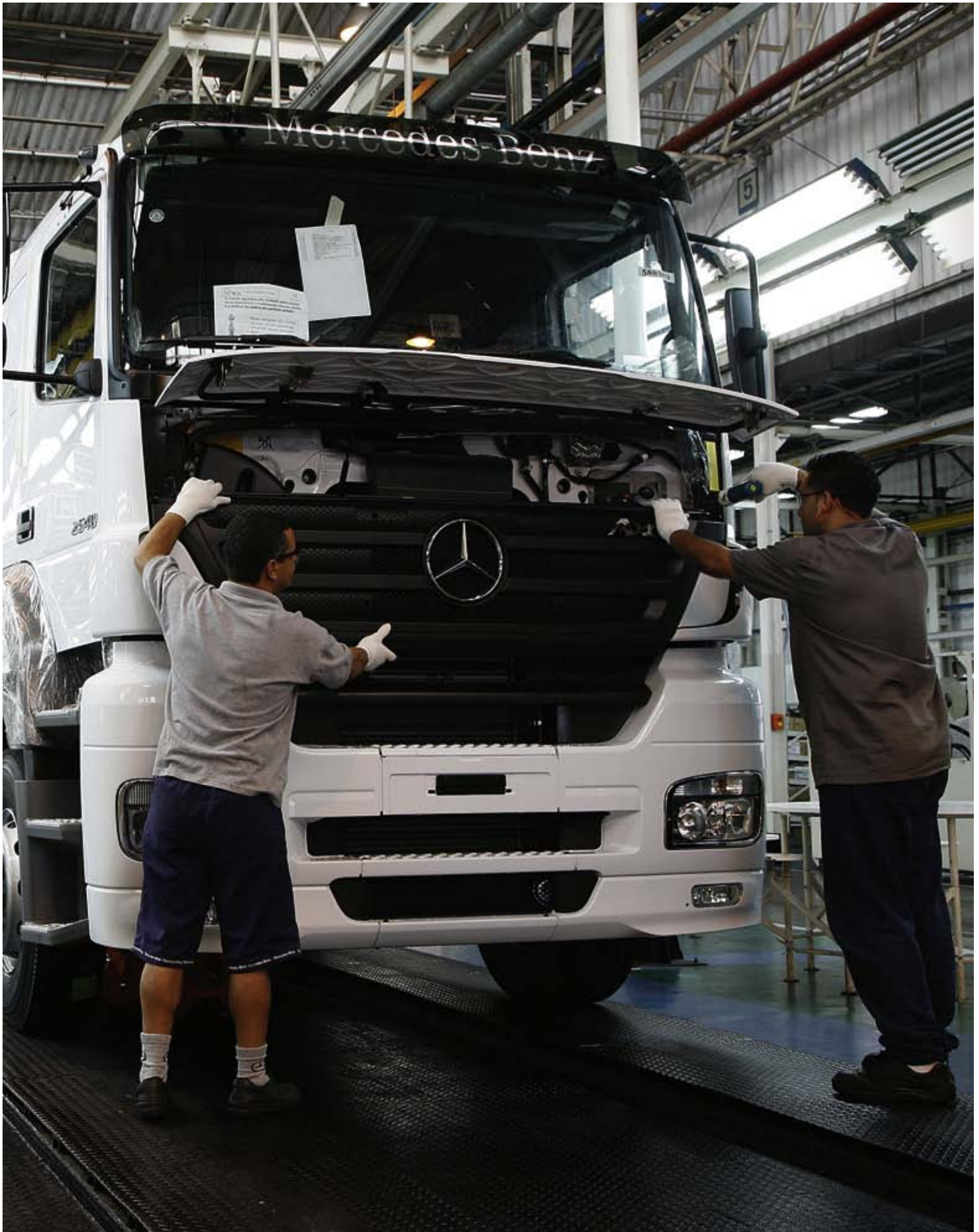
Durch die Erweiterung der Nutzfahrzeugproduktion auf den Standort Juiz de Fora kann Mercedes-Benz do Brasil die steigende Nachfrage in Lateinamerika perfekt bedienen.