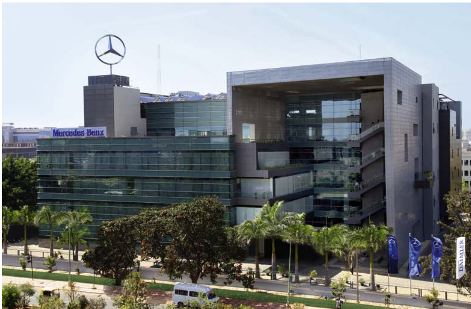
Größter Standort für Forschung und Entwicklung außerhalb Deutschlands – und Teil unserer weltweiten Wachstumsstrategie: das neu eröffnete Mercedes-Benz Research and Development Center India in Bangalore.

In Sao Bernardo do Campo produziert Daimler seit den 1950er-Jahren Lkw, Busfahrgestelle, Motoren, Getriebe und Achsen für Lateinamerika. Um von den Wachstumsperspektiven der brasilianischen Wirtschaft optimal profitieren zu können, vergrößerten und modernisierten wir nicht nur unser Traditionswerk, sondern etablierten mit Juiz de Fora auch einen weiteren Produktionsstandort. Hier fertigt Mercedes-Benz do Brasil den bewährten Mercedes-Benz Actros sowie den Accelo, einen Leicht-Lkw für den lateinamerikanischen Markt.