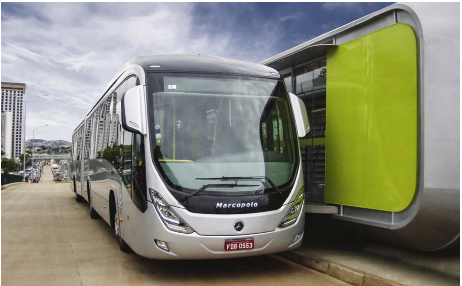
Schon heute sind rund 70 Prozent der Stadtbusse in den Bus-Rapid-Transit-Systemen Brasiliens von Mercedes-Benz.